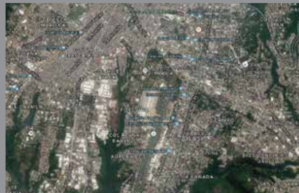
Hasta el MUNAE