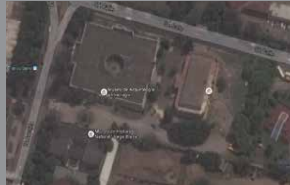
Toma cenital con Dron, cambio difuminado entre toma anterior.