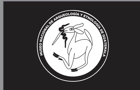
Zoom back para descubrir el logotipo en la piedra.

Música de tambores llegando a su final con cierre dramático.