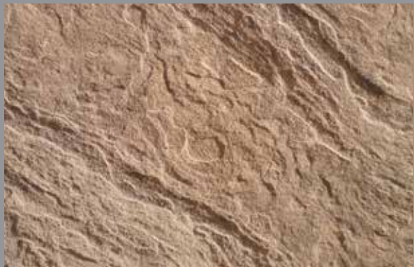
Tenemos una toma de primerísimo primer plano. Con textura de piedra.