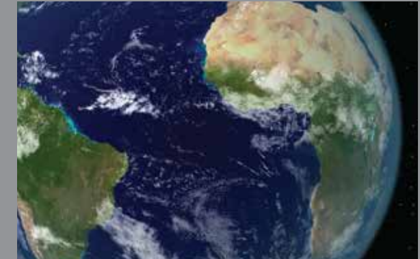
Tenemos un recorrido