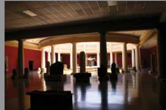
Toma con el dron entrando por la abertura de la sala y luego tomas por el museo