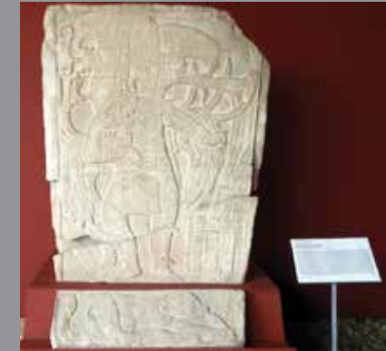
Zoom in a una estela maya para llegar a un plano de detalle.