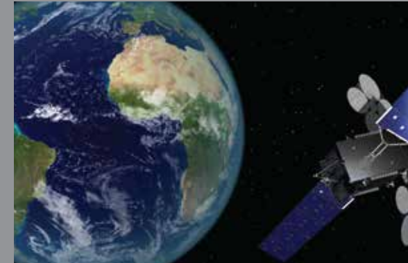
Se realiza un traveling de cámara a un zoom in.

Se aleja la cámara y vemos un gran plano general.