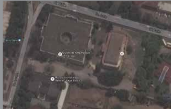
Se realiza un Tild Up para hacer una toma cenital.

- CLIENTE: MUSEO NACIONAL DE ARQUEOLOGÍA Y ETNOLOGÍA - PRODUCTO: SPOT WEB - MEDIO: YOUTUBE - PÁGINA WEB - DURACIÓN: 30 SEGUNDOS