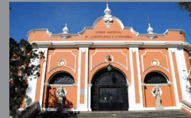
Pan right con un giro para enfocar solo la entrada del MUNAE.