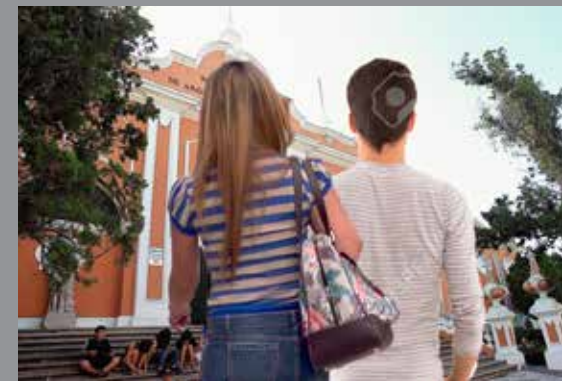
Plano entero de unos jovenes de espalda caminando hacia el MUNAE.