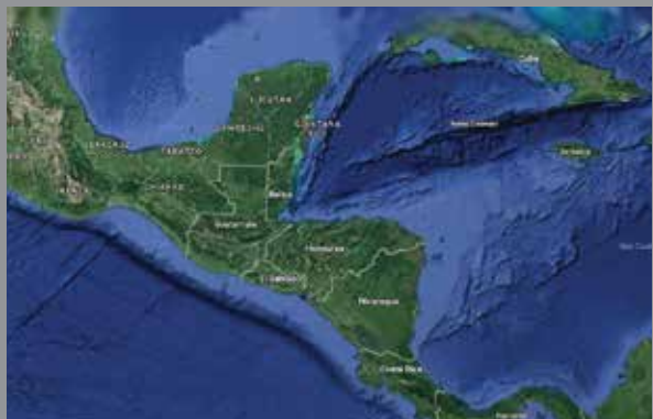
Desde el satélite